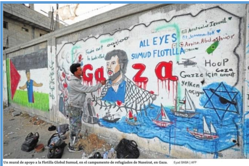
Un mural de apoyo a la Flotilla Global Sumud, en el campamento de refugiados de Nuseirat, en Gaza.

A lo largo de esta semana en diversas localidades de Euskal Herria se han llevado a cabo diversos actos de protesta ante las últimas actuaciones de Israel. Pero, por desgracia, no renunciará a su comportamiento